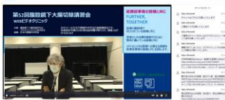
オンサイトハンズオン